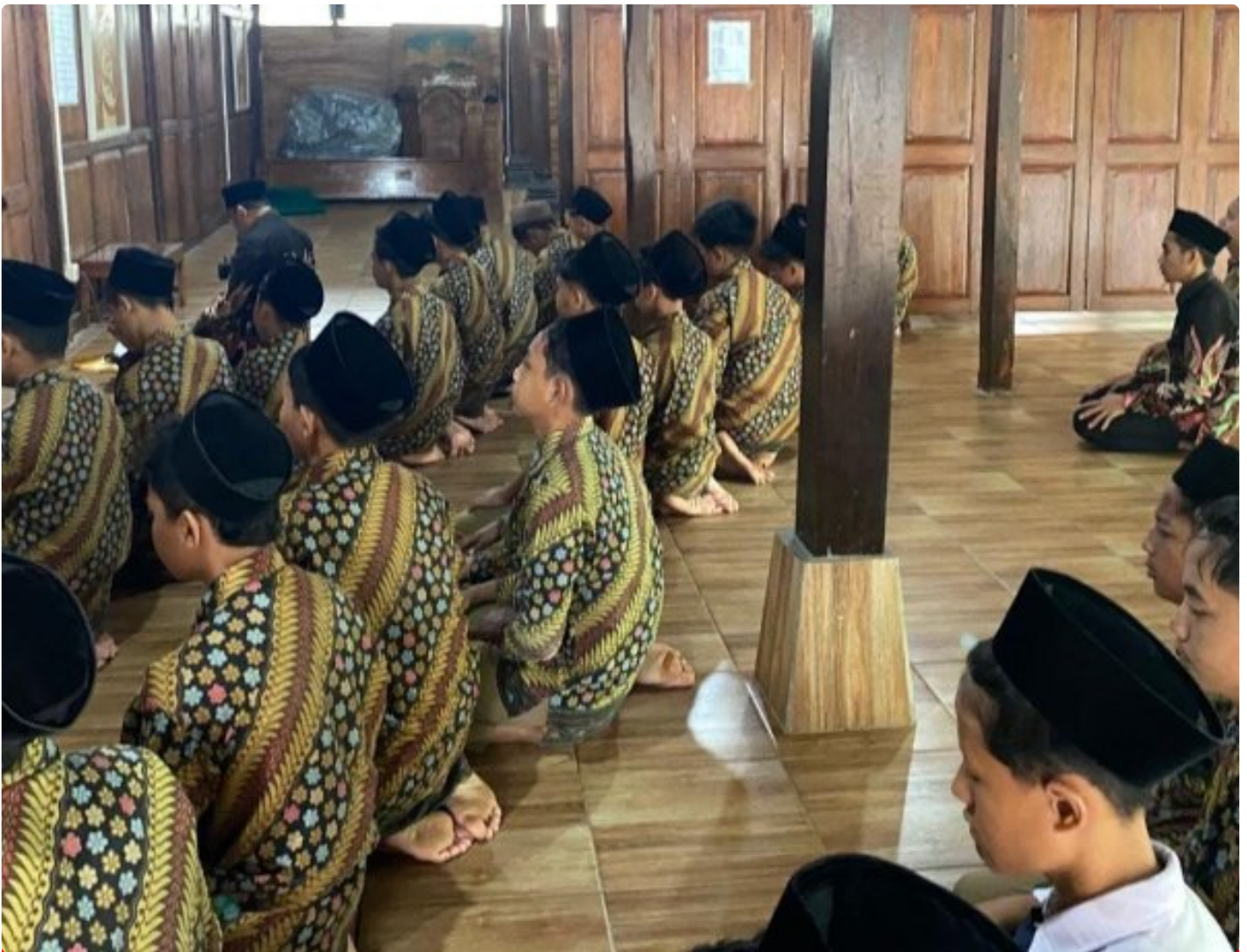
Ruh Pagi Menyala di SMP Persada Insan Nusantara Tebuireng 17 Sokaraja

SOKARAJA - SMP Persada Insan Nusantara, unit pendidikan di bawah PP Abdul Djamil Tebuireng 17 Sokaraja, Banyumas, terus meneguhkan komitmennya dalam membangun karakter peserta didik melalui pembiasaan ruhaniyah. Seperti hari ini Rabu pagi (03/12/2025).